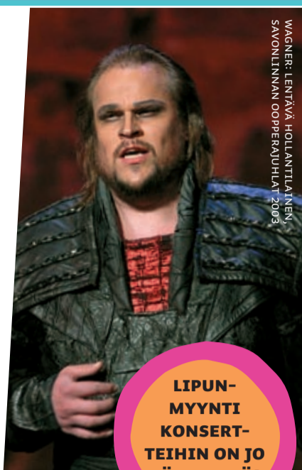
WAGNER: LENTÄVÄ HOLLANTILAINEN, SAUVONLINNAN OOPPERAUKHILAT 2003