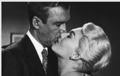
JAMES STEWART & KIM NOVAK